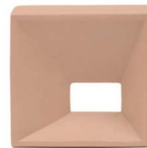
34827 CASTELLO CLAY/20X20 H41 (20,5x20,5 cm — 8 1 / 16 x8 1 / 16 "