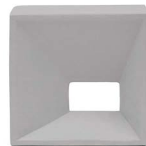
34826 CASTELLO GREY/20X20 H41 (20,5x20,5 cm — 8 1 / 16 x8 1 / 16 "