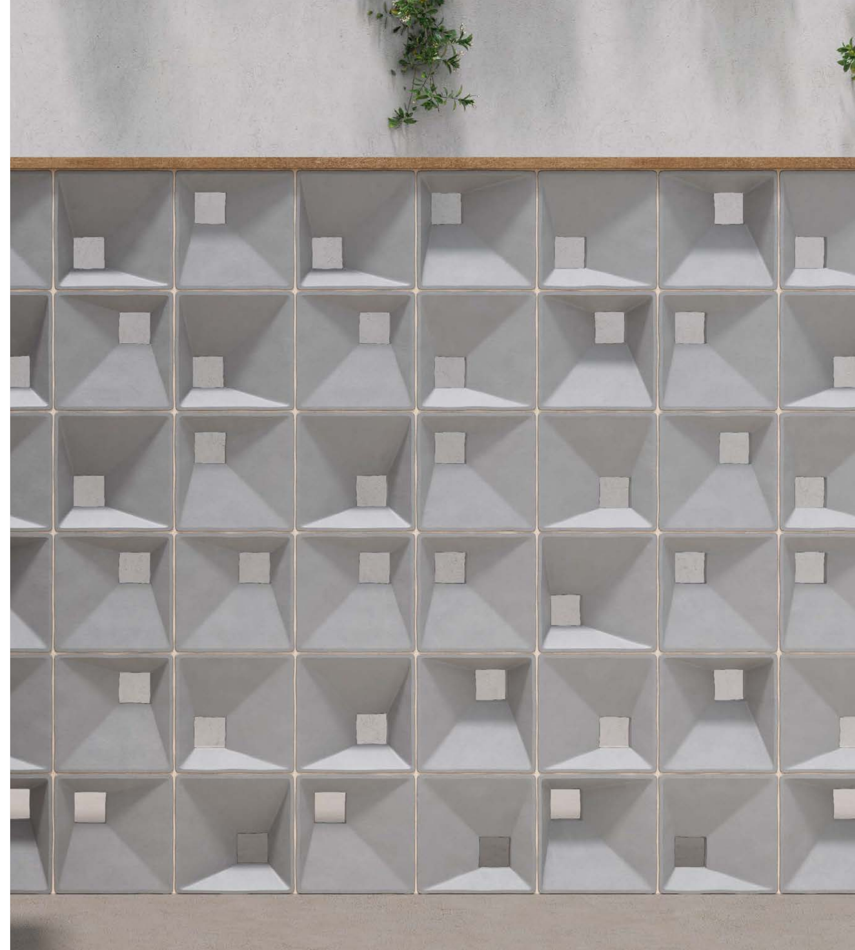
● CASTELLO GREY/20X20

"EL ZAGUÁN DE ARITCO" BY AS INTERIORSTA - CASA DECOR 2023